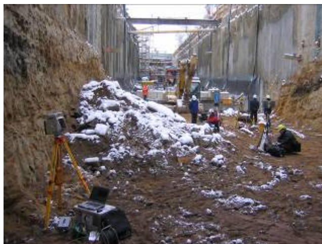
Scantag am BV U-Bahn Fürth

Nach mehreren Vorgesprächen zur Projektfestlegung mit Projektplan, Projektzielsetzung und Projektdetaillierung der zu bearbeitenden Projektinhalte, fand der Scantag am Bauvorhaben U-Bahn Fürth, Hardhöhe statt.